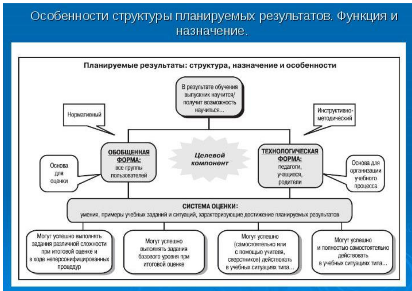
Рис. 1. Особенности структуры планируемых результатов.

3) обеспечивает комплексный подход к оценке результатов освоения основной образовательной программы основного общего образования, позволяющий вести оценку предметных, метапредметных и личностных результатов основного общего образования; Рис. 1